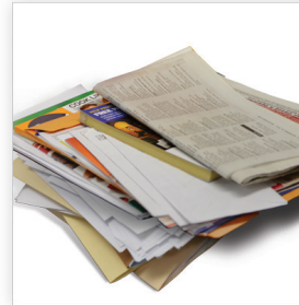
Periódicos, Revistas, Correspondencia no Deseada