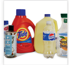
Plasticos #1 y #2